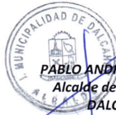
PABLO ANDRÉS LEMUS PEÑA Alcalde de la comuna (S) DALCAHUE