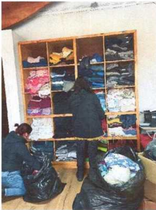
Imagen N° 1. Separación, orden y limpieza de la ropa en el punto de acopio.