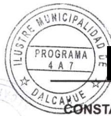
CONSTANZA MOREIRA EUGENIN MONITORA - PROGRAMA 4 A 7