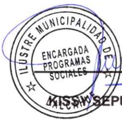
KISSY SEPÚLVEDA BARRIA PROGRAMAS SOCIALES