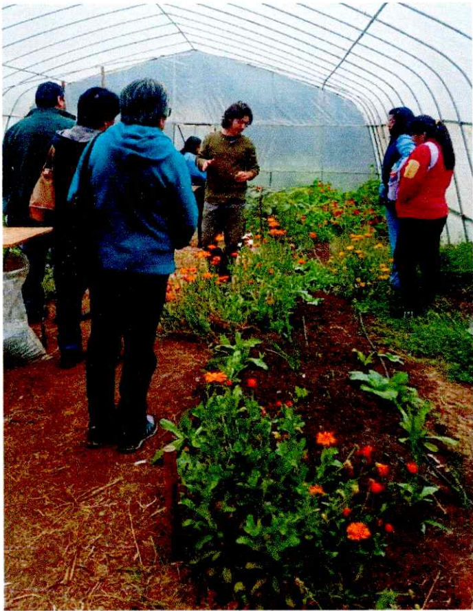
Imágenes de lo realizado: