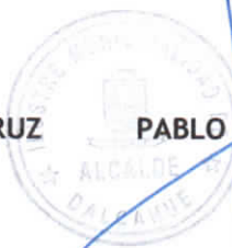
PABLO ANDRES LEMUS PEÑA ALCALDE (S)