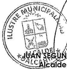
JUAN SEGUNDO HIJERA SERÓN Alcalde de la Comuna DALCAHUE