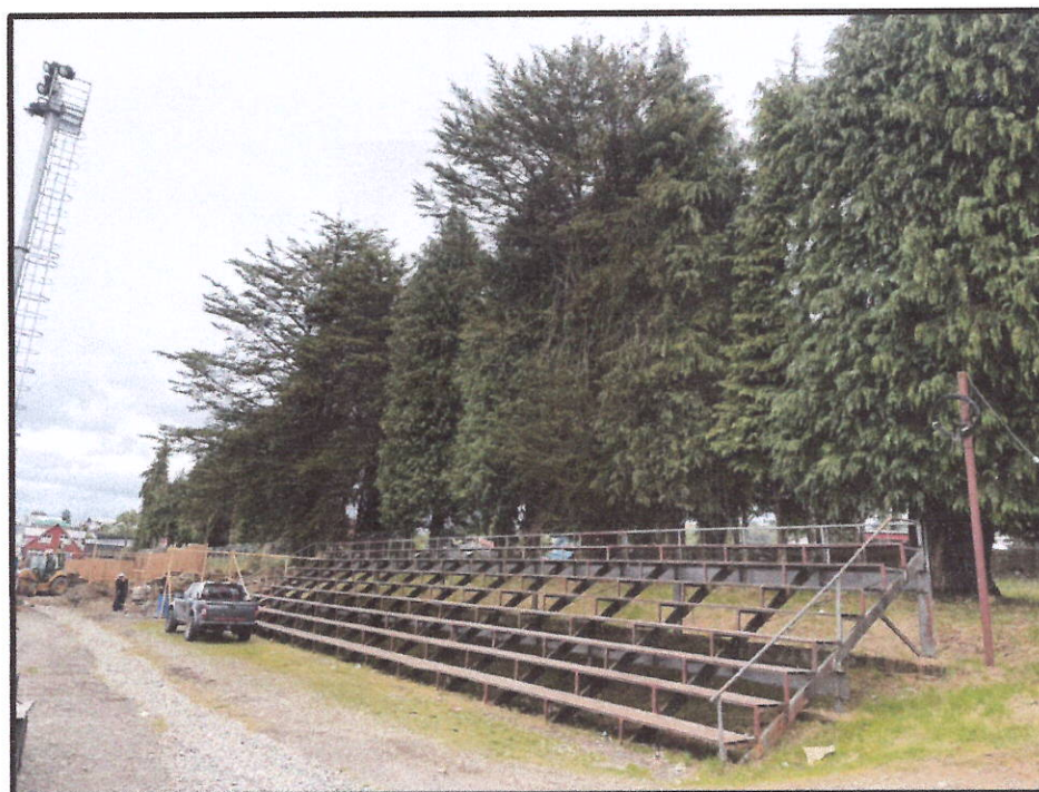
Pata interior club de rodeos de dalcahue