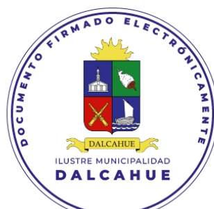
ALCALDESA DE LA COMUNA DALCAHUE