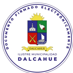
SECRETARIA MUNICIPAL DALCAHUE