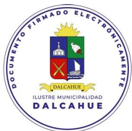
SECRETARIA MUNICIPAL DALCAHUE

ANÓTESE, COMUNÍQUESE A LA DIRECCIÓN DE ADMINISTRACIÓN Y FINANZAS Y ARCHÍVESE.