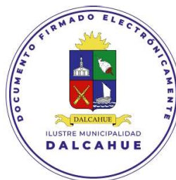
ALCALDESA DE LA COMUNA DALCAHUE