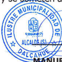
MANUEL ANIBAL ÁLVAREZ BARRÍA ALCALDE (S) ILUSTRE MUNICIPALIDAD DE DALCAHUE