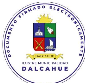
ALCALDESA DE LA COMUNA DALCAHUE