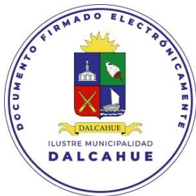
SECRETARIA MUNICIPAL DALCAHUE

ANÓTESE, COMUNÍQUESE A LA DIRECCIÓN DE ADMINISTRACIÓN Y FINANZAS Y ARCHÍVESE.